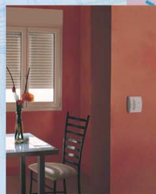
Doté des dernières technologies Radio, le Bloc B vous apportera "le confort à portée de main".

Le Bloc B PVC SODICOB une fois monté sur la menuiserie, constitue un ensemble homogène, doté de grandes performances thermiques et acoustiques .