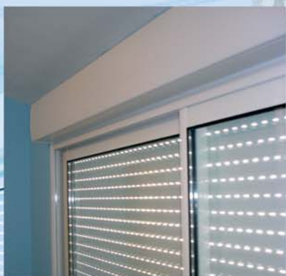
Le coffre de Bloc B existe en 3 dimensions pour s'ajuster au mieux à la taille du volet roulant et de la menuiserie.