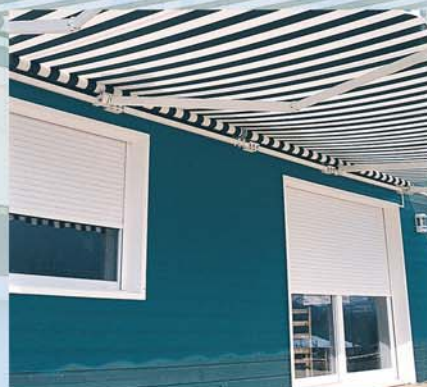
Vue de l'extérieur, le coffre disparaît derrière le linteau et devient invisible.