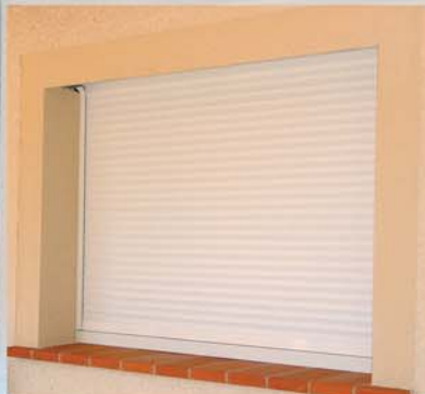
Volet roulant TRADITIONNEL dans coffre tunnel